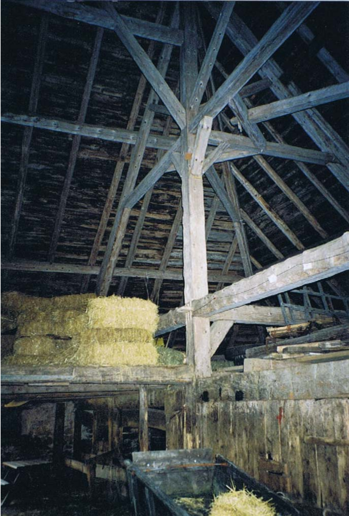
Un seul mot : splendide !