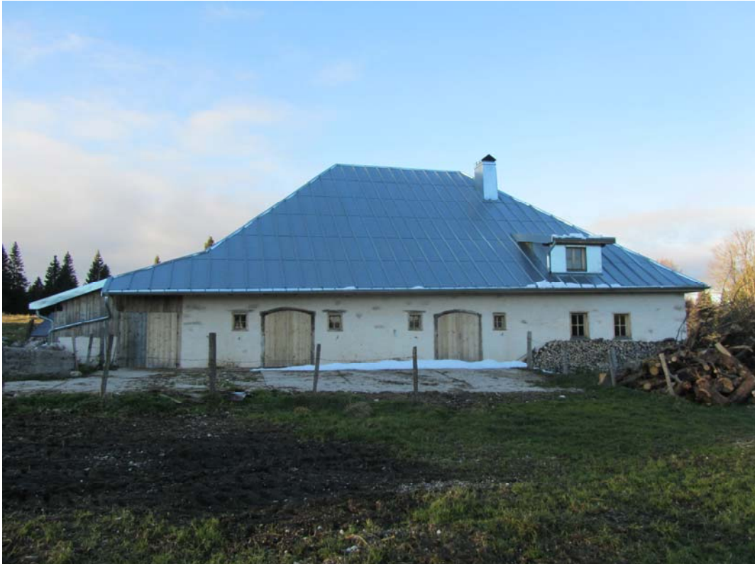
Un toit néanmoins superbe.