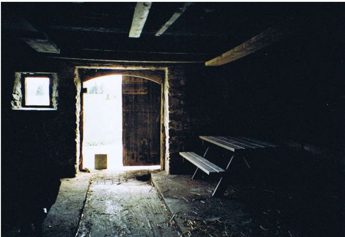
La porte de grange était alors ouverte, juste jeter un coup d'œil sur cet intérieur antique et sur cette magnifique poutraison à voir ci-dessous.