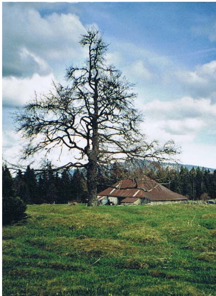
On était de même arrivé par l'arrière.

N'empêche, on a toujours dans l'œil, et dans la boîte, fort heureusement, le bâtiment tel qu'il se présentait encore il y a quelque dix ans. La preuve ci-dessous.