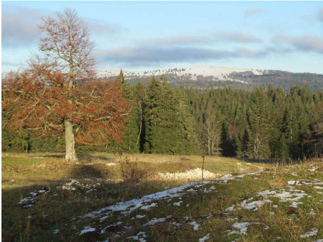
Superbe vue sur le Mont d'Or. Le vieil arbre est heureusement toujours là.