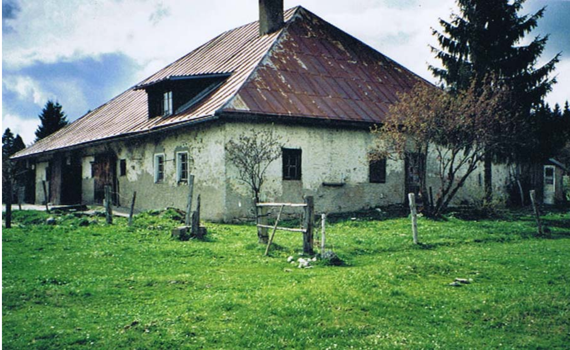
Sa vétusté si poétique.