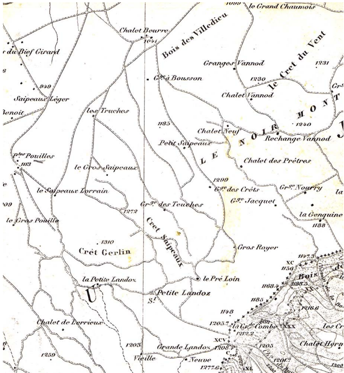
Carte topographique du canton de Vaud 1877/1880. La Grange Nourrie, dite ici Nourry, est à droite. Les trois chalets sus-jacents, Le Chalet Neuf (en fait le Chalet-Neuf de la Grange à Bousson), la Rechange Vannod, (en fait le Chalet Neuf signalé comme ruine sur la carte de 1985), et le Chalet des Prêtres, ont tous disparu. Il y a ainsi cette constatation à faire que les alpages situés au cœur même du Noirmont, donc les plus éloignés des centres habités, ont pratiquement tous disparu, pour laisser en service les chalets et granges situés, soit le long de la Grand 'Combe, soit sur les hauts du vallon de Mouthe, à distance modérée de celui-ci.