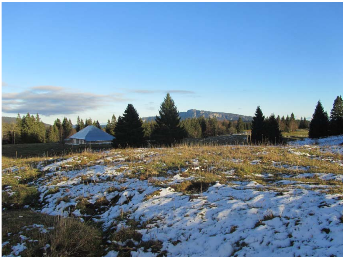
C'est en ce moment précisément que nous nous sommes rendu compte que le chalet n'était plus le même, avec la réfection complète du toit, passant de la couleur rouille à un gris métallisé relativement commun.